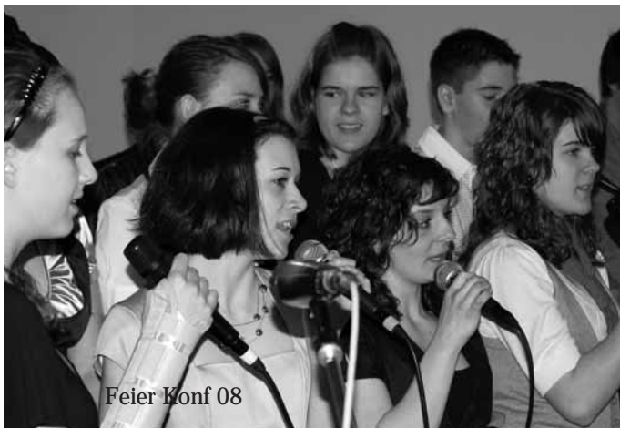
Feier Konf 08