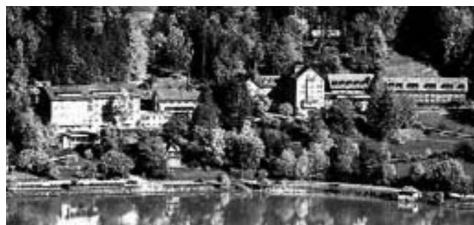
2008 wurde das Zentrum Ländli als zweitbestes Seminarhotel in der Schweiz mit einer Silbermedaille ausgezeichnet

Möchten Sie sich einmal königlich verwöhnen lassen? Dann dürfen Sie die Seniorenferienwoche im Ländli bei Oberägeri nicht verpassen. Zusammen mit der Seniorentribüne haben wir vom Samstag, 12. bis Freitag 18. September 09 für Sie reserviert.