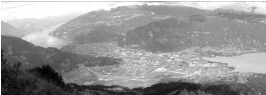
Der Tourismusort Interlaken liegt zu Füssen des Dreigestirns Eiger, Mönch und Jungfrau.