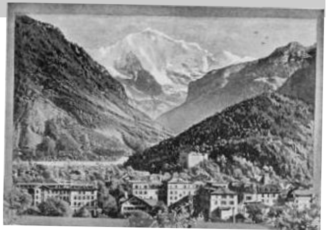
Bis 1891 hiess Interlaken „Aarmühle“.

Verträgliches geben – damit einer erholsamen Nacht nichts im Wege steht. Das Hotel mit liebevollem Verwöhncharakter wird in allen Bereichen entgegenkommend wirken: Ich habe das Personal als sehr zuvorkommend und äusserst freundlich erlebt. Selbstverständlich sind alle Zimmer mit Lift