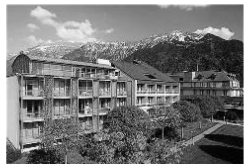
Das Hotel Artos mit Verwöhncharakter.